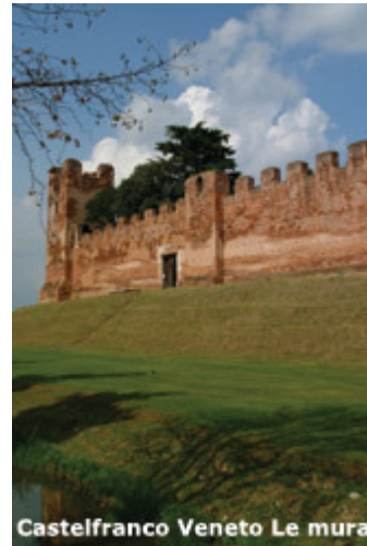
Castelfranco Veneto Le mura

Lasciamo l'auto e passeggiamo lungo il porticato. Di fronte a noi la fortezza si impone rigorosa nelle sue mura a pianta quadrata. All'angolo della Piazza, un tempo sede del mercato delle bestie, sorge la Loggia del Grano (detta Paveion ), costruita ai tempi della Serenissima ed inizia Corso XXIX Aprile, su cui si affaccia l'interessante facciata affrescata di Palazzo Bovolini-Soranzo (del XVI sec.), e su cui si apre, sul versante delle mura, Porta Treviso , la meglio conservata delle due superstiti. Da qui ci immettiamo nella Piazza S. Liberale su cui si affacciano il Duomo in stile illuministico con splendida pala del Giorgione, il Municipio , l'ex Monte dei pegni ora Biblioteca civica e la casa gotica Marta Pellizzari conosciuta come Casa del Giorgione : i decori in una stanza all'interno sono attribuiti al grande pittore rinascimentale.