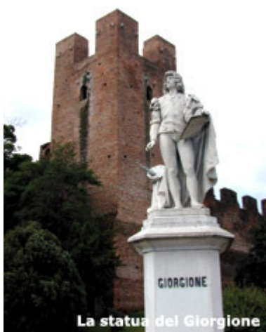
La statua del Giorgione

Dietro al Municipio, sulla via Garibaldi, osserviamo la facciata in cotto del Teatro Accademico . Percorrendo via Preti fino al lato opposto, attraverso palazzetti gotico-rinascimentali, giungiamo a Porta Cittadella . Torniamo quindi a Porta Treviso e, usciti dalla cinta muraria, imbocchiamo via Riccati (subito a destra la Chiesa di S. Giacomo ) che poco avanti si trasforma in Borgo Treviso, fino all'Ottocentesco Palazzo Revedin-Bolasco , il cui splendido parco è visitabile nei pomeriggi di sabato e prima domenica del mese