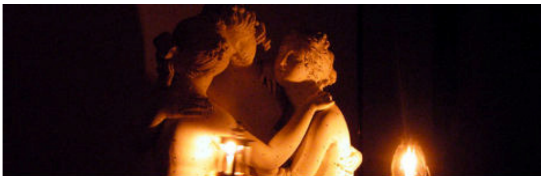
Innamorati dell'arte, alla tenue luce di Psiche